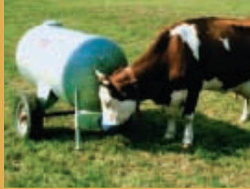
Les abreuvoirs mobiles proposent de l'eau propre en tout temps.

Lors de fortes chaleurs, les animaux doivent disposer en permanence d'eau propre.