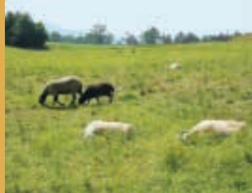
Cette prairie manque d'ombre.