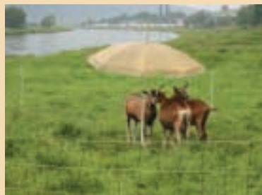
Les chèvres ne veulent en aucun cas se mouiller.