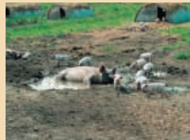
Les porcs ont besoin d'une souille en été.

nence regagner leur abri. Ces derniers doivent être bien fournis en litière.