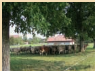
Si les vaches ont trop chaud, leur production laitière diminue.