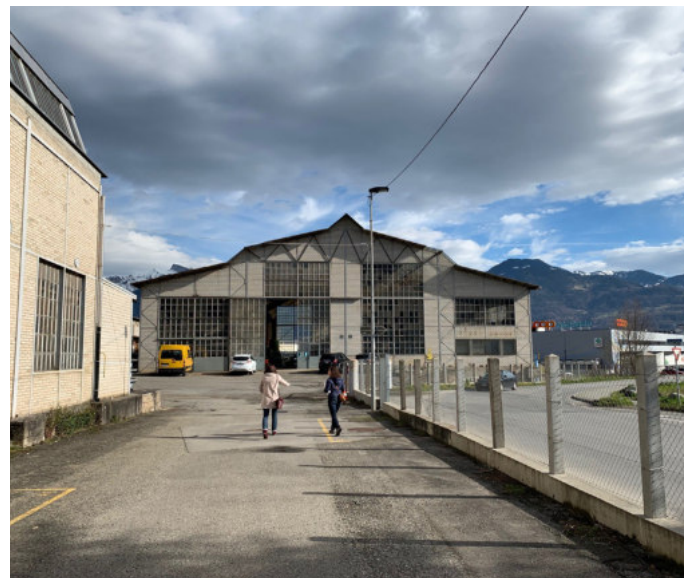
Monthey im Chablais

Wenn die landwirtschaftlichen Aktivitäten in einem Gebiet eingestellt werden, verliert die Landschaft ihre Vielfalt und ihre historischen Besonderheiten, in der Regel dehnt sich die Waldlandschaft aus. Die produktive Kapazität des Bodens nimmt ab.