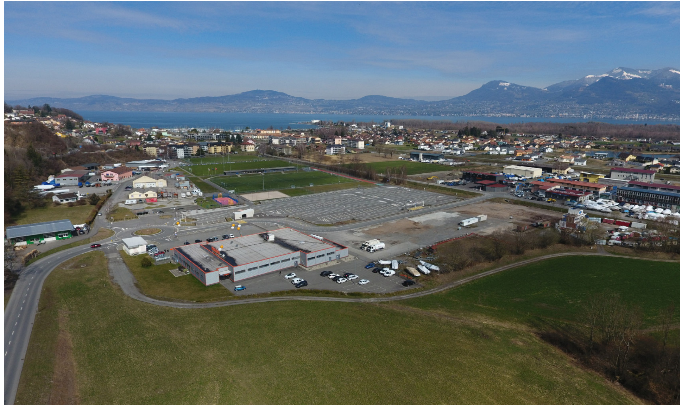
Le Bouveret im Chablais