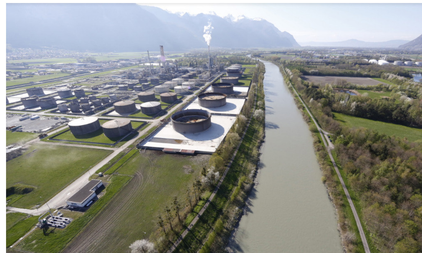
Chablais - Tamoil-Raffinerie