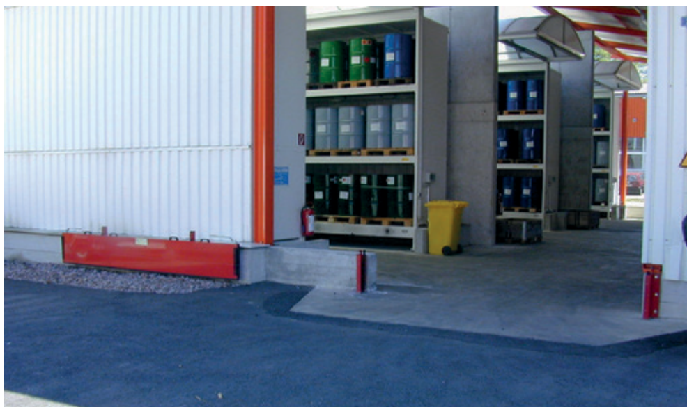
Barrière à eaux d'extinction manuelle