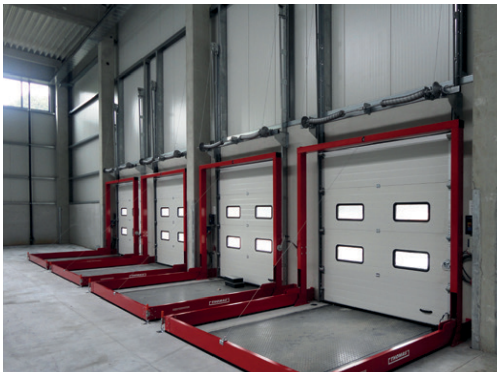
Barrières à eaux d'extinction automatiques pour quais de chargement

– Arrêt des pompes d'eaux usées: lorsqu'une pompe est installée dans un volume de rétention, elle peut être déclenchée de manière ciblée en cas d'incendie pour empêcher que les eaux d'extinction ne soient pompées et rejetées dans les canalisations. Il est possible de coupler la pompe au dispositif de détection incendie afin, qu'elle soit mise hors service automatiquement lorsque le dispositif de détection s'enclenche.