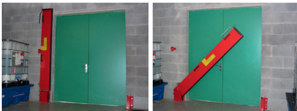
Barrière à eaux d'extinction semi-automatique