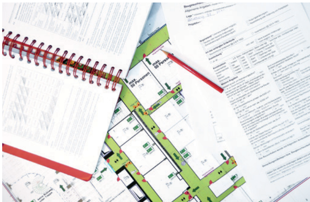
La protection incendie commence dès la planification.