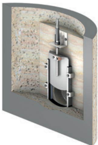
Vanne d'arrêt actionnée manuellement

Le type de dispositif technique à mettre en œuvre est généralement fixé par l'autorité d'exécution en fonction des exigences en matière de sécurité. Les puits des vannes doivent être accessibles en permanence, par exemple en maintenant l'emplacement libre à l'aide de poteaux.