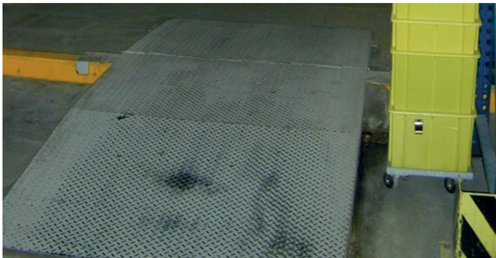
Un passage approprié permet d'assurer le fonctionnement sans entrave d'un dispositif de rétention fixe.