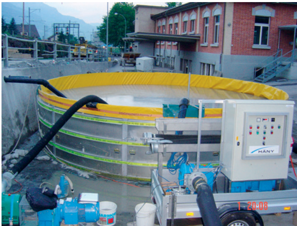
Exemple de cuve de rétention mobile