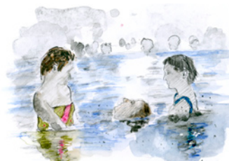
Les bains de Val d'Illiez

BEG Bureau d'Etudes Géologiques SA CH-1961 Epagny 027 3461878 bureau@beg-geol.ch www.beg-geol.ch