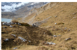
Dolines dans la région du lac de Salanfe