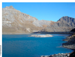
Lac de Salanfe

Durch hydrogeologische Studien wurden die hydraulischen Zusammenhänge zwischen dem Stausee von Salanfe und den Thermalquellen von Buchelieule aufgezeigt. Die Wasserverluste des Stausees werden durch den stark löslichen Felsen verursacht. Unter den Dents du Midi tauchen die Felsen nach Nord-Westen ab, was den unterirdischen Wasserabfluss ins Val d'Illiez begünstigt. Das Wasser zirkuliert bis in eine Tiefe von mehr als einem Kilometer und erwärmt sich dabei auf 30 °C. Auf seiner Reise durch den Untergrund löst das Wasser die mineralischen Komponenten der Felsen wie Sulfat, Kalzium und Magnesium. Daher rühren seine bekannten therapeutischen Qualitäten.