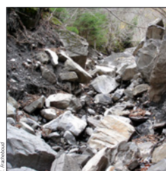
Matériaux déposés dans le lit du cours d'eau vers 1220m d'altitude

Pour protéger efficacement le village contre les crues, il faut identifier et évaluer les risques, puis les réduire en planifiant des mesures de protection pertinentes. Les cartes de dangers sont à la base de cette démarche. Le territoire est subdivisé en différentes zones. Selon les événements susceptibles de se produire, des restrictions sont prévues. Pour les personnes par exemple, la zone rouge signifie qu'il y a danger aussi bien à l'intérieur qu'à l'extérieur des bâtiments. Dans la zone jaune, le danger est faible ou absent.