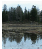
Verträumte Spiegelungen in Bergseen

Bienvenue à Moosalp. Vous vous trouvez au départ de la magnifique promenade du «Chemin de l'eau». Ce parcours d'environ 2 heures vous conduit à travers un paysage unique jusqu'à Zeneggen, typique village valaisan. Une brochure d'accompagnement en couleur peut être obtenue gratuitement aux restaurants de Moosalp. Le département des transports, de l'équipement et de l'environnement du canton du Valais et son service de la protection de l'environnement vous souhaitent beaucoup de plaisir.