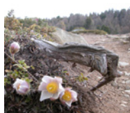
Blühende Anemonen am Wegrand