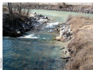
La Borgne rejoint le Rhône