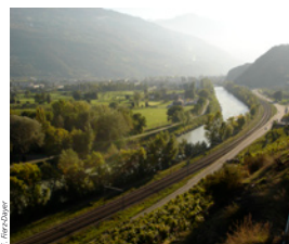
Le Rhône poursuit son cours jusqu' à la mer