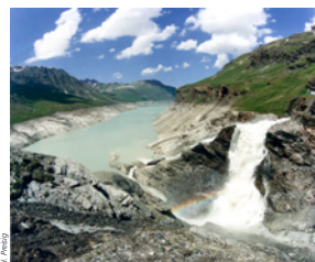
Déversement des eaux de la galerie