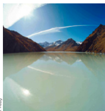
Lac des Dix