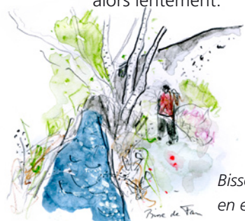
Bisse de Fan en eau