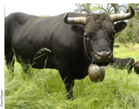
Vache de la race d'Hérens, reine du troupeau

Chaque dimanche, le « procureur » du bisse organisait la commande de l'eau pour la semaine suivante. Une fois par année, il était chargé d'encaisser les droits d'eau. Cette réglementation minutieuse traduit l'importance que revêtaient les bisses dans la société agro-pastorale traditionnelle, où chaque brin d'herbe comptait.