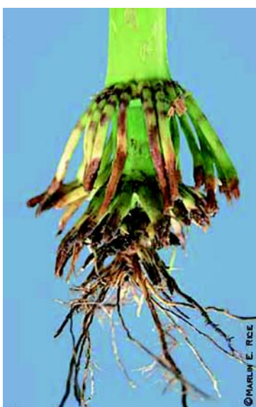
racines rongées par les larves

L'adulte (5 mm) peut voler sur de grandes distances pour rechercher un maïs aux soies appétissantes (maïs en floraison). La femelle dépose alors ses oeufs dans le sol et ce n'est que le printemps suivant que ceux-ci donnent naissance à de petites larves. Celles-ci ne peuvent se développer que si elles y trouvent des racines de maïs. La larve (~ 12 mm) termine son développement en juillet, se nymphose et l'adulte sort de terre et recommence le cycle. Il n'y a qu'une génération par année mais l'insecte a besoin de deux années successives de maïs sur la même parcelle pour pouvoir accomplir son développement.