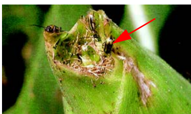
soies rongées par les adultes