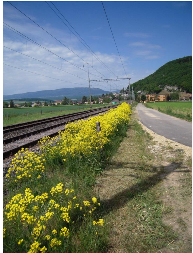
Bunias orientalis (Photo : )