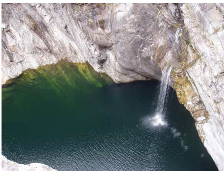
Klippenspringer - Weltmeisterschaften in der Maggia

Brontallo wurde wie alle peripheren Dörfer im Tessin von zwei Auswanderungswellen heimgesucht, die erste im 19. Jahrhundert in ferne Länder in Übersee, die zweite Mitte des 20. Jahrhunderts in die grösseren Städte des Tessin. In den letzten 25 Jahren kam es jedoch im Gegensatz zu den umliegenden Dörfern im Maggiatal zu einem Stillstand des Bevölkerungsrückgangs. Die Arbeitsmöglichkeiten im Dorf selbst sind beschränkt. Im Primärsektor sind 12 Personen beschäftigt. Fünf Landwirtschaftsbetriebe halten einen Viehbestand von 350 Ziegen und Schafen und einigen Rindern. Viele Erwerbstätige pendeln täglich in den Raum Locarno / Ascona. Brontallo bildet seit 2004 zusammen mit fünf weiteren Fraktionen die neue Gemeinde Lavizzara. Heute leben 60 Einwohner im Dorf, wovon 13 Kinder sind, also eine erfreuliche Altersstruktur und ein Versprechen für die Zukunft.