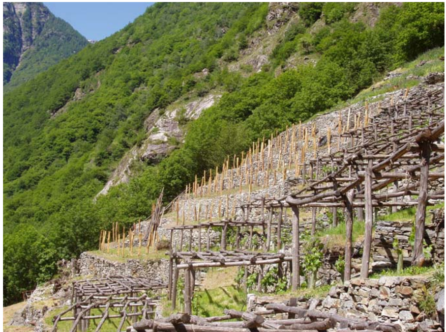
Wiederherstellung der Trockenmauern und der für Brontallo typischen Pergola- reben