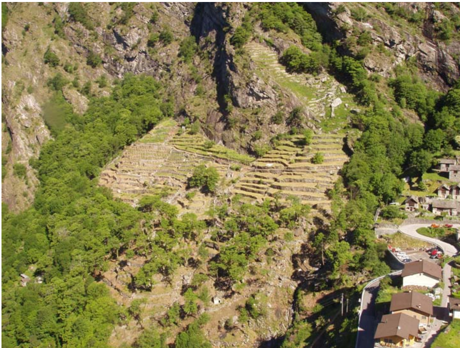
Rebhang beim Dorf, geschützt durch wärmespeichernde Felswände