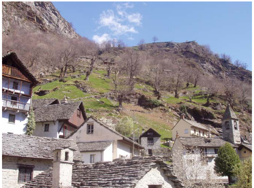
Brontallo, malerisches Tessinerdorf mit Kastanienhainen