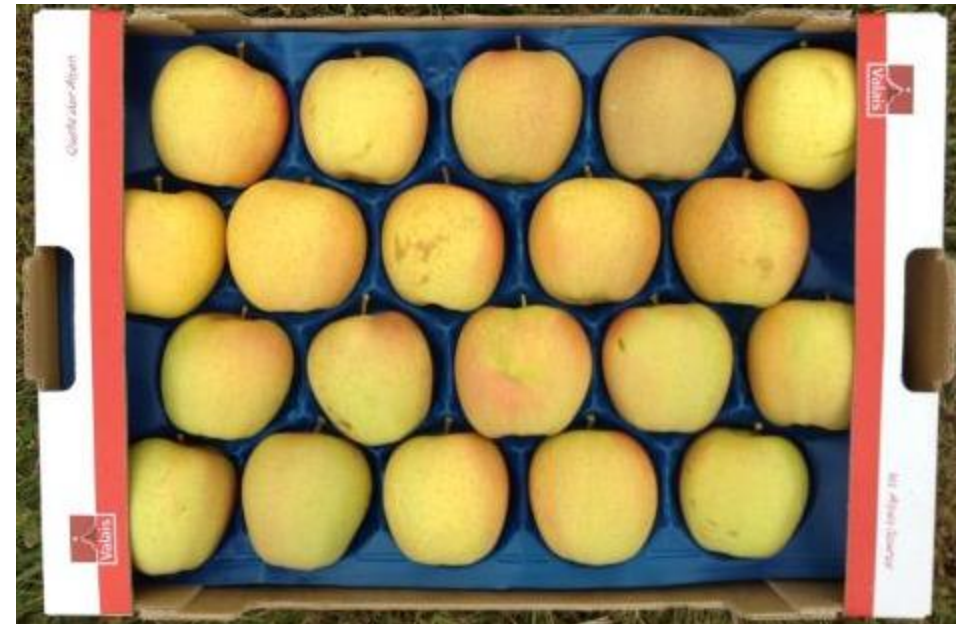
Face non exposée