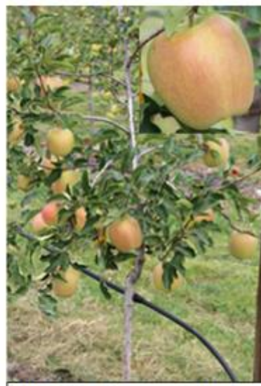
GOLDEN PARSI(S) DA ROSA®