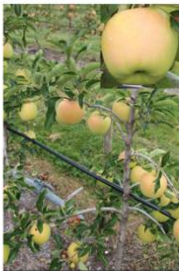
GOLDEN CLONE B

Verger: Porte-greffe: M9 (T337) Knip 7+ 2 ème feuille Surface Salsa: 2466 m 2 Surface Centrifuge: 2466 m 2 Surface haute densité: 2200 m 2