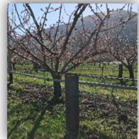
Prototype à pellets (HES-SO)