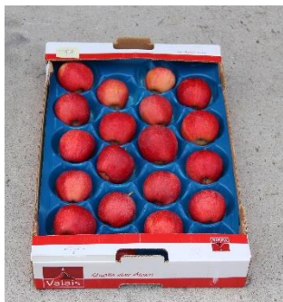
7 ème feuille 2023