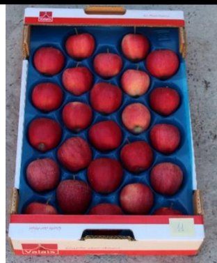
5 ème feuille 2021