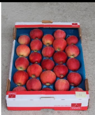
6 ème feuille 2022