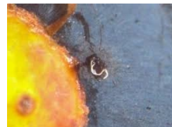
Ponte avec filament

Seuil de tolérance : 4% de baies avec pontes