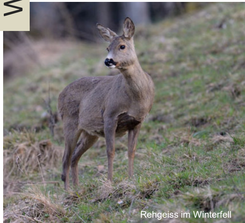
Rehgeiss im Winterfell

Das Reh ist kein ausdauernder Läufer, sondern schlüpft bei Gefahr in Deckung (Schlüpfertyp). Der hinten erhöhte Körperbau ist optimal an dieses Verhalten angepasst. Typisch für flüchtendes Rehwild sind zudem sogenannte Widergänge (Zurückkehren in der eigenen Fährte mit seitlichem Abspringen) um den Verfolger abzuschütteln.