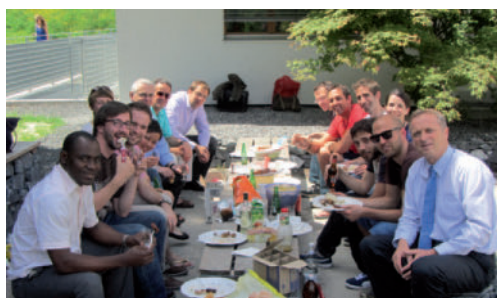
La HEP-Valais offre des formations reconnues dans toute la Suisse Die PH-Wallis bietet schweizweit anerkannte Ausbildungen an

* un enseignant peut être compté plusieurs fois