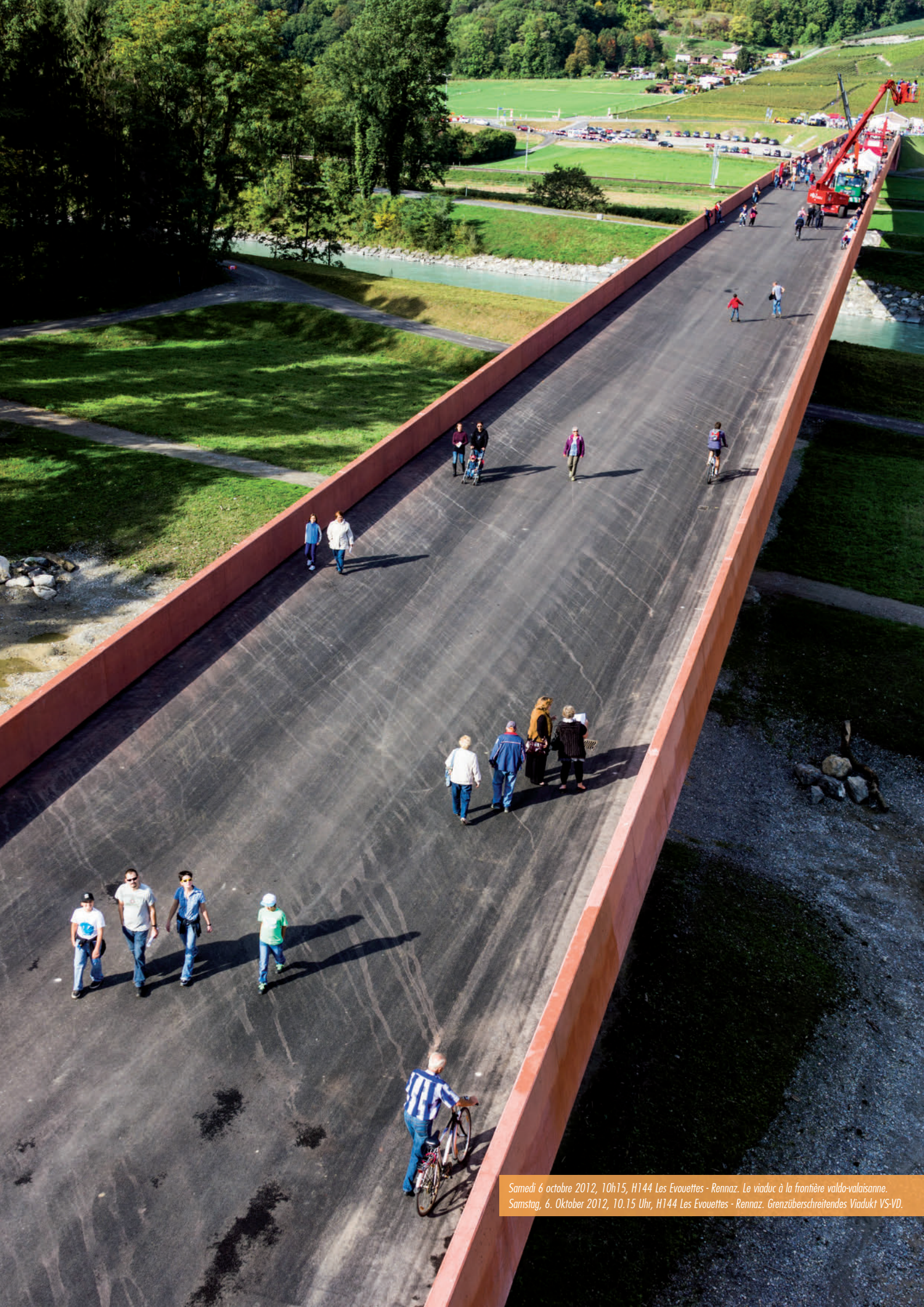
Samedi 6 octobre 2012, 10h15, H144 Les Evouettes - Rennaz. Le viaduc à la frontière valdo-valaisanne. Samstag, 6. Oktober 2012, 10.15 Uhr, H144 Les Evouettes - Rennaz. Grenzüberschreitendes Viadukt VS-VD.