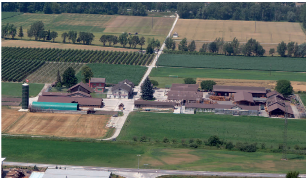
Pénitencier de Crêtelongue: un projet de construction adaptera les lieux de détention et les ateliers aux standards actuels Strafanstalt Crêtelongue: ein Bauprojekt will die Gefängniszellen und Ateliers dem heutigen Standard anpassen

Bezüglich der medizinischen Versorgung in den Gefängnissen wurde die Vereinbarung zwischen DFIG, DSSI und GNW für ein Jahr verlängert.