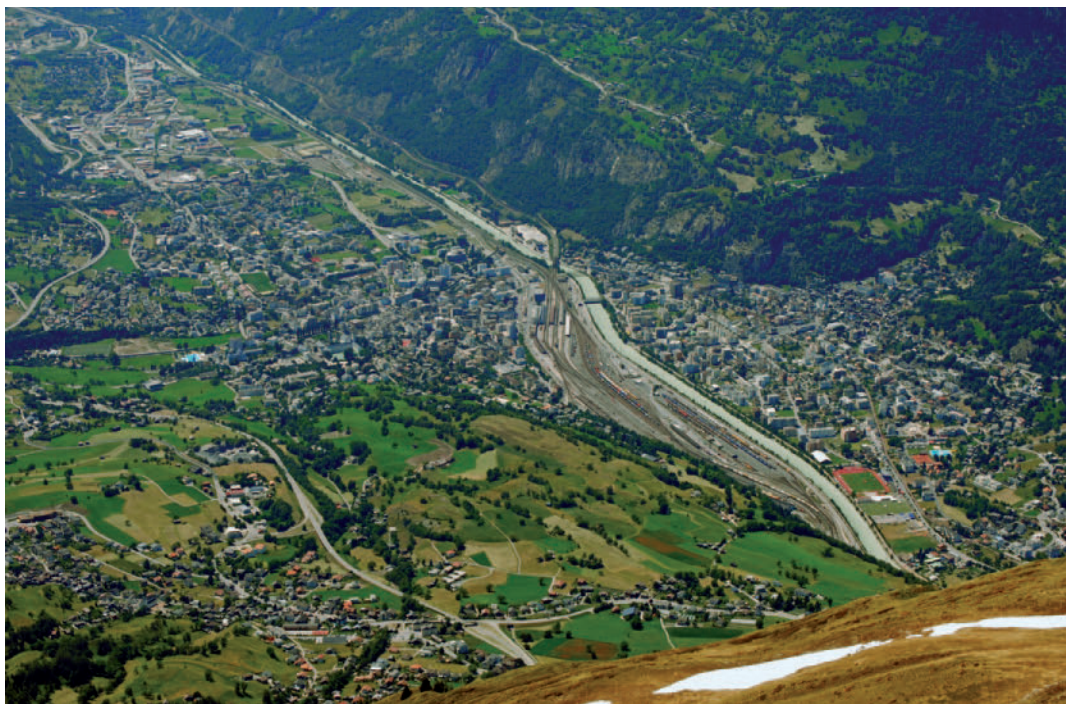
Le projet révisé d'agglomération Brigue-Viège-Naters a été soumis à la Confédération en juin 2012 Das überarbeitete Agglomerationsprojekt Brig-Visp-Naters wurde dem Bund im Juni 2012 unterbreitet

Der Kanton setzte sich in Zusammenarbeit mit den betroffenen Gemeinden für die Sicherstellung einer effizienten und koordinierten Umsetzung des Programms ein. Er wird sich auch künftig in der Projektorganisation der drei Agglomerationen engagieren und die Arbeiten am Agglomerationsprogramm auf fachlicher Ebene begleiten.