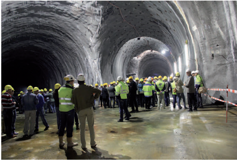
31.08.2012, Eyholz Percement des derniers mètres des 4.255 km du tube sud du tunnel de l'A9 Durchstich des 4.255 km langen Südtunnels der A9 Visp Staldbach