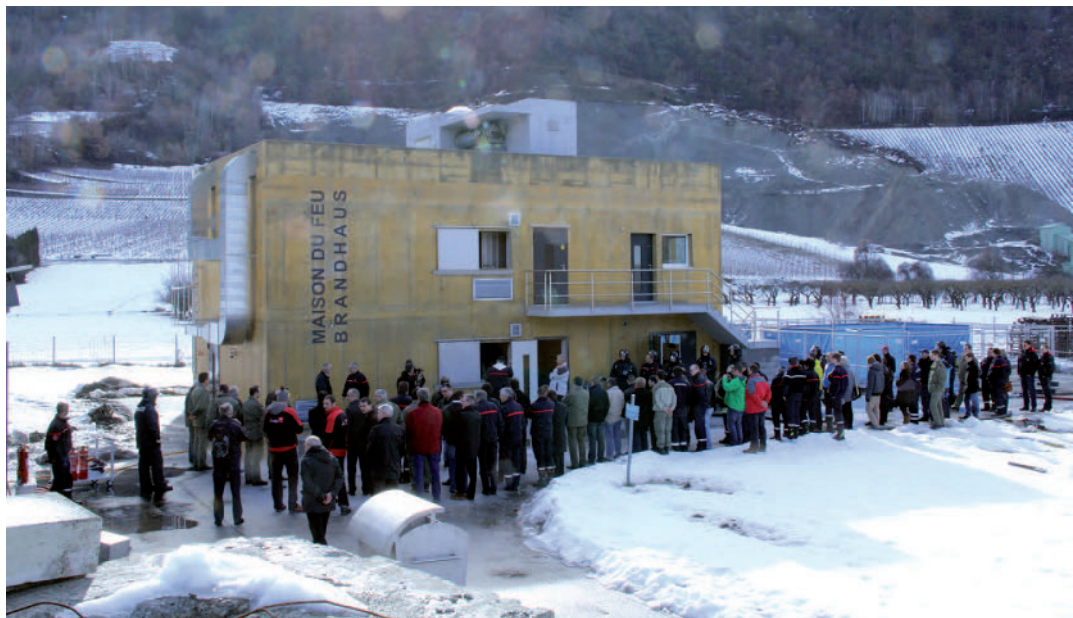
La nouvelle maison du feu à Grône : à fin 2012 le concept cantonal des sapeurs-pompiers était quasi réalisé Das neue Brandhaus in Grône: Ende 2012 war das neue kantonale Feuerwehrcorps zum grössten Teil umgesetzt

Zum jetzigen Zeitpunkt sind 90% des Konzeptes realisiert. In einer Gemeinde im Unterwallis und in 18 Gemeinden im Oberwallis laufen noch die Zusammenlegungsarbeiten. Zurzeit gibt es 70 Gemeindecorps für das gesamte Wallis, geplant sind deren 60.