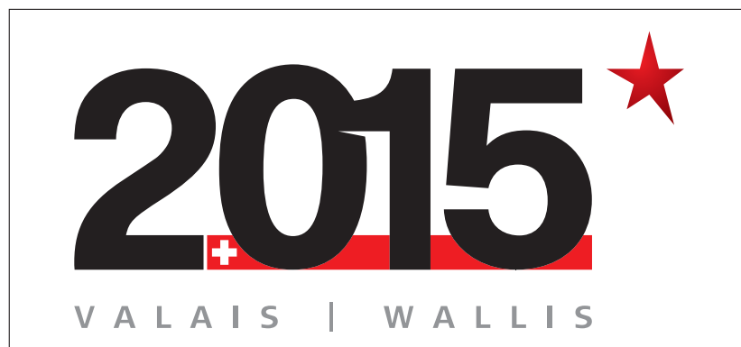
Logotype des festivités des 200 ans de l'entrée du Valais dans la Confédération helvétique Logo zur 200-Jahr-Feier des Walliser Beitritts zur Eidgenossenschaft

Im Rahmen des 200-jährigen Jubiläums des Beitritts des Wallis zur Eidgenossenschaft entschied der Staatsrat, unter der Bevölkerung einen Projektwettbewerb zu lancieren. Das Rahmenprogramm der verschiedenen Veranstaltungen 2015 besteht aus „Sternprojekten“ und „Label-2015-Projekten“ sowie einer offiziellen Feier am 7. August 2015. Dem Aufruf im September 2012 folgte die Einreichung von 269 Projekten. Eine neun-köpfige Jury unter der Leitung von Martine Brunshawig-Graf ist mit der Auswertung der Projekte beauftragt. Die Gewinner werden 2013 bekannt gegeben.