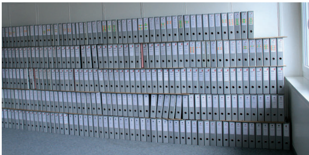
A fin 2012, le Service des affaires intérieures et communales a traité plus de 1200 recours de l'Association Helvetia Nostra Bis Ende 2012 hat die Dienststelle für innere und kommunale Angelegenheiten 1200 Einsprachen der Helvetia Nostra erhalten

Der Staatsrat hat am 26. September 2012 die von der Arbeitsgruppe ad hoc gemachten Änderungsvorschläge genehmigt. Die Änderungen klären bzw. vereinfachen das Textverständnis (Kreditbegriffe, Kompetenzen). Die Verbesserungen wurden vorgenommen, um die bisher gezogenen Lehren und gemachten Erfahrungen umzusetzen. Ausnahmen wurden eingeführt (Präsentation des Finanzplans, Jahresrechnung, Voranschlag, Revision), um die Anforderungen an die Grösse der Gemeinden anzupassen.