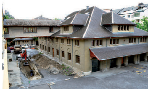
Le Centre culturel des Arsenaux abritera notamment la Médiathèque et les Archives Das alte Zeughaus Sitten beherbergt zukünftig die Mediathek Wallis und das Staatsarchiv