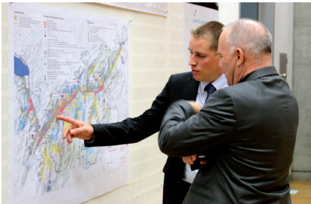
Le projet de concept cantonal de développement territorial a été discuté avec les communes valaisannes lors de deux ateliers organisés en automne 2012 Der Entwurf des kantonalen Raumentwicklungskonzeptes wurde im Herbst 2012 anlässlich zweier Workshops mit den Walliser Gemeinden diskutiert

Bezüglich der Gesamtrevision des kantonalen Richtplans wurde ein Benchmarking mit den Richtplänen der dritten Generation der anderen Kantone durchgeführt. Die Arbeiten für die Revision des Richtplans werden bis 2015 fortgesetzt.