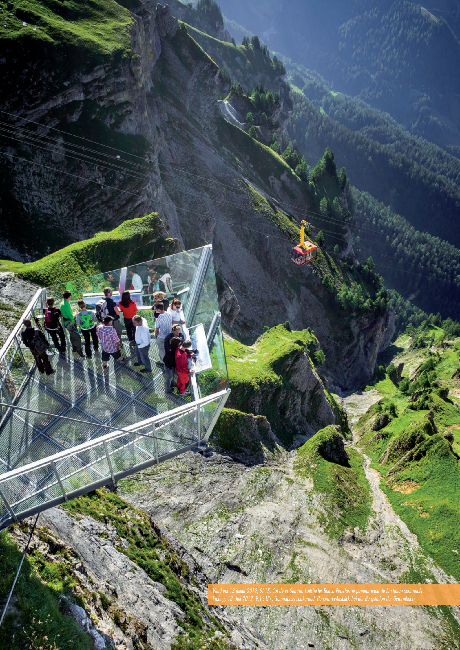
Vendredi 13 juillet 2012, 9h15, Col de la Gemmi, Loèche-les-Bains. Plateforme panoramique de la station sommitale. Freitag, 13. Juli 2012, 9.15 Uhr, Gemmipass Leukerbad. Panorama-Ausblick bei der Bergstation der Gemmibahn.