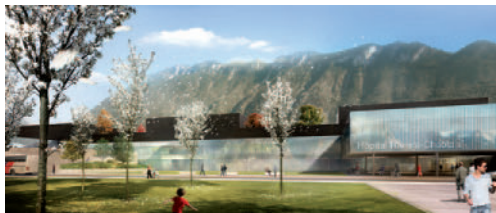
Le futur Hôpital Riviera Chablais Vaud - Valais Das zukünftige Spital Riviera Chablais Vaud - Valais

Après le nouveau régime de financement des soins de longue durée en 2011, le nouveau financement hospitalier est entré en vigueur au 1er janvier 2012, avec notamment un renforcement de la concurrence entre tous les établissements hospitaliers de Suisse, qu'ils soient publics ou privés. Les cantons disposent d'un délai à fin 2014 pour revoir leur planification et adapter leur liste hospitalière.