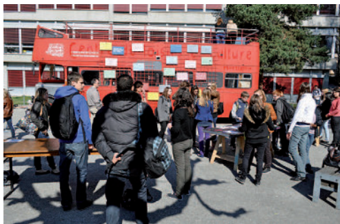
26.03.2012, Martigny Semaine valaisanne contre le racisme, étudiants travaillant sur le projet Walliser Woche gegen Rassismus, Studierende arbeiten am Projekt

Zusätzlich zu den spezifischen Integrationsmassnahmen (Sprachkurse, Integrationsprojekte) legt der Kanton ein besonderes Augenmerk auf die interinstitutionelle Zusammenarbeit und die Regionalisierung der Leistungen. Auf diese Weise will man die Effizienz steigern und eine grössere Zahl von Migrantinnen und Migranten in unserem Kanton erreichen.