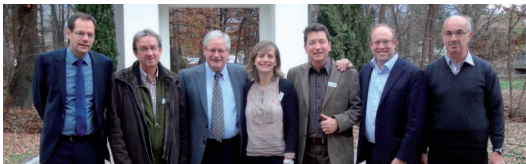
Les acteurs d'un Observatoire de la jeunesse : le Service de la jeunesse, le Secrétariat à l'égalité et à la famille et l'Institut Universitaire Kurt Bösch Die Akteure des Jugendobservatoriums: die Dienststelle für die Jugend, das Sekretariat für Gleichstellung und Familie und das Institut Kurt Bösch

Der Staatsrat hat wichtige Grundsätze zur Gründung eines kantonalen Jugendobservatoriums beschlossen. Mit dem geplanten Observatorium soll die Koordination der kantonalen Jugendpolitik verbessert und gleichzeitig eine kantonale Strategie zur Prävention von Jugendgewalt umgesetzt werden.