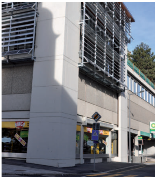
Assainissement parasismique du bâtiment des FMV: les refends sismiques externes en B.A. permettent de lier entre elles les dalles des étages Erdbebensanierung des FMV-Gebäudes: Durch die externen Erdbebenwände aus Armierbeton können die Geschossdecken untereinander verbunden werden

En conséquence, un séisme majeur aurait des conséquences très importantes sur le bâti existant. Si un séisme majeur devait survenir prochainement, les autorités cantonales et communales seraient en outre dans l'impossibilité d'avoir une réaction adaptée. Pour cette raison et en collaboration avec l'Office cantonal de la protection de la population (OCP), la section H2G a mis sous toit un «Concept de préparation et d'intervention en cas de tremblement de terre» (COCPITT), qui devrait obtenir prochainement l'aval du Conseil d'Etat. Dans le cadre d'un projet pilote, ce concept sera concrétisé sur le périmètre urbain de la commune de Sion et testé lors d'un exercice mis sur pied dans le cadre de la prolongation du projet Interreg RiskNat (France - Italie - Suisse).