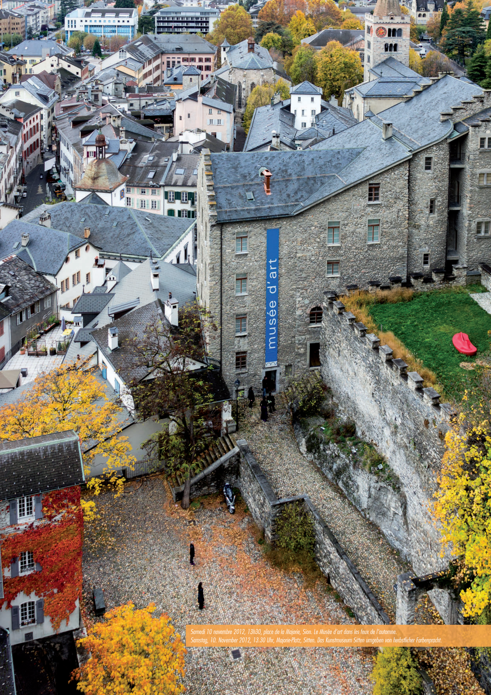
Samedi 10 novembre 2012, 13h30, place de la Majorie, Sion. Le Musée d'art dans les feux de l'automne. Samstag, 10. November 2012, 13.30 Uhr, Majorie-Platz, Sitten. Das Kunstmuseum Sitten umgeben von herbstlicher Farbenpracht.