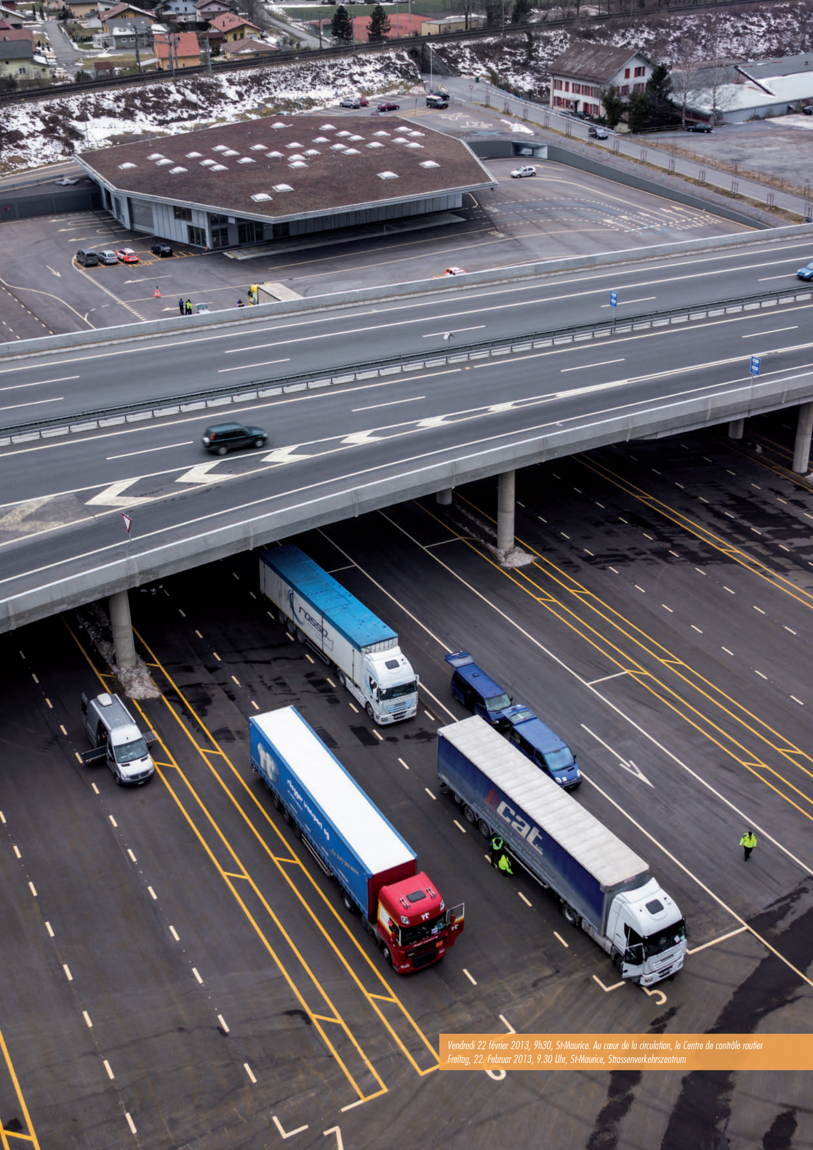
Vendredi 22 février 2013, 9h30, St-Maurice. Au cœur de la circulation, le Centre de contrôle routier Freitag, 22. Februar 2013, 9.30 Uhr, St-Maurice, Strassenverkehrszentrum