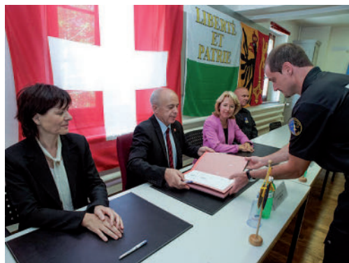
21.06.2012, Savatan Le Valais, Vaud et la Suisse prolongent leur partenariat dans l'Académie de police Wallis, Waadt und Eidgenossenschaft verlängern die Partnerschaft zur Polizeiakademie

Toutefois, si l'une de ces variantes n'est pas remplie (d'ici fin 2016), la commune pourra temporairement acheter des prestations auprès de la Police cantonale contre l'acquittement d'un forfait par habitant. Ces prestations ne pourront cependant être achetées que dans le seul domaine de la sécurité publique.